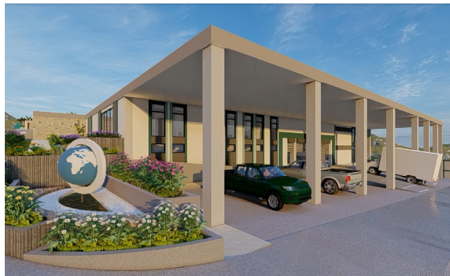
Fase I Diseño de la fachada

Estamos profundamente agradecidos con todos los que se han sumado a este esfuerzo y seguimos buscando los fondos restantes para hacer realidad esta visión transformadora para Honduras