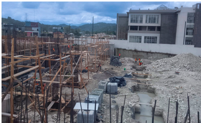
Fase I Actualmente

Nuestra campaña representa un paso decisivo para fortalecer la infraestructura sanitaria, atender las crecientes necesidades de la población hondureña y garantizar un futuro más saludable para quienes dependen de los servicios vitales de CAMO.